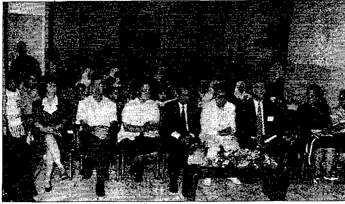
● جانب من المدعومين والحضور

● الخبر: - اليوم انتخابات تجمع لجان المرأة الوطني حيث تتنافس نحو ٢٥٣ مرشحة للفوز بنحو ٢٥٣ مقعدا في جميع المحافظات. ● تكشمة: - أعداد المرشحات خاصة في محافظات العاصمة وأربيد والكرك ضعف عند القاعد مما يؤكد حجم المنافسة والحرص على الفوز. ● الزيادة: - واتقن من نجاح التجربة - ستتمنن الفوز للاندفاع على خدمة قطاع المرأة، مع كل التقدير والاحترام للجهود الكبيرة المبذولة لانجاح التجربة. ■ عوني الداوود